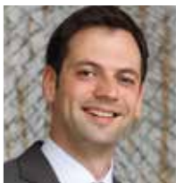
Marc Lürbke, Sprecher für Bevölkerungsschutz und Sicherheit, Feuerwehr und Streitkräfte der FDP-Fraktion im Landtag Nordrhein-Westfalen

Es ist seit Jahrzehnten gute Gepflogenheit, dass Jugendoffiziere der Bundeswehr auf Einladung von Schulen Jugendliche unter pädagogischer Begleitung über Sicherheitspolitik informieren. Marc Lürbke, Experte für Streitkräfte der FDP-Fraktion, befürchtet, dass SPD und Grüne mit dieser Tradition der politischen Bildung brechen und das Engagement der Bundeswehr in Schulen austrocknen wollen. „Im neuen Kooperationsvertrag mit der Bundeswehr hat die Landesregierung die Hürden für die Besuche deutlich erhöht. Jugendoffiziere sollen laut Ministerium nur in Schulen sprechen dürfen, wenn zugleich eine Friedensinitiative eingeladen wird.“ Lürbke hat Zweifel, ob Schulen das Angebot dann künftig noch nutzen. „Was passiert, wenn keine Friedensinitiative zur Verfügung steht?“, fragt er. Zudem fordert Lürbke von Rot-Grün Informationen, wie sichergestellt wird, dass sich die Organisationen ebenso wie die Bundeswehr an das Überwältigungsverbot halten.