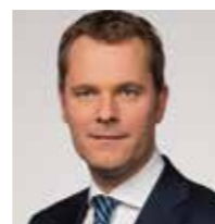
Daniel Bahr, Bundesminister für Gesundheit, Mitglied des Bundestages